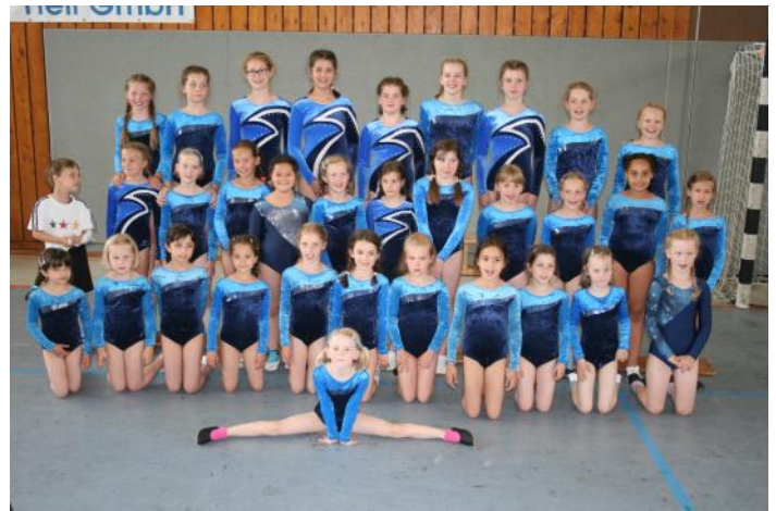
Teilnehmer des Turnfestes

Spitzenweine aus dem Bopparder Hamm Riesling, Spätburgunder, Barrique, Winzersekte weiß und rot !!! Hefebrand, Gelee, Traubensaft, sowie viele Geschenkideen Goldmedaillen auf alle Riesling Spätlesen und Auslese