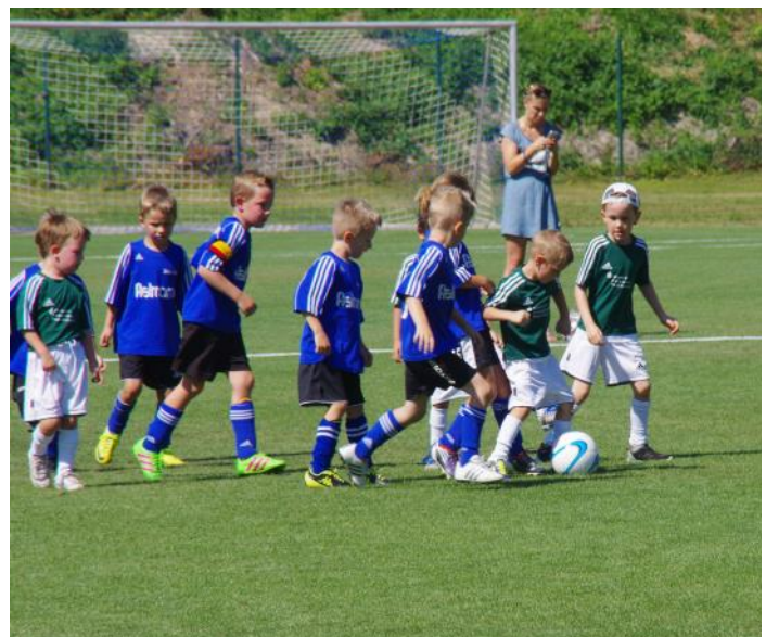
Unsere jüngsten Fußballer durften als erste ein Spiel auf dem neuen Rasen austragen