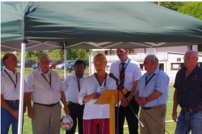
Ein Blick auf die Ehrengäste bei der Einweihung