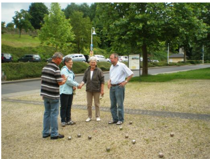
Boulen an der Stadtmauer seit 2012

Nach langer Wartezeit ist es endlich soweit: Seit 29. August 2016 können wir wieder an alter Wirkungsstätte auf dem Sportplatzgelände spielen. Wir teilen jedoch unser Spielfeld mit den Fußballern. Die Nutzung wird in einem Belegungsplan geregelt.