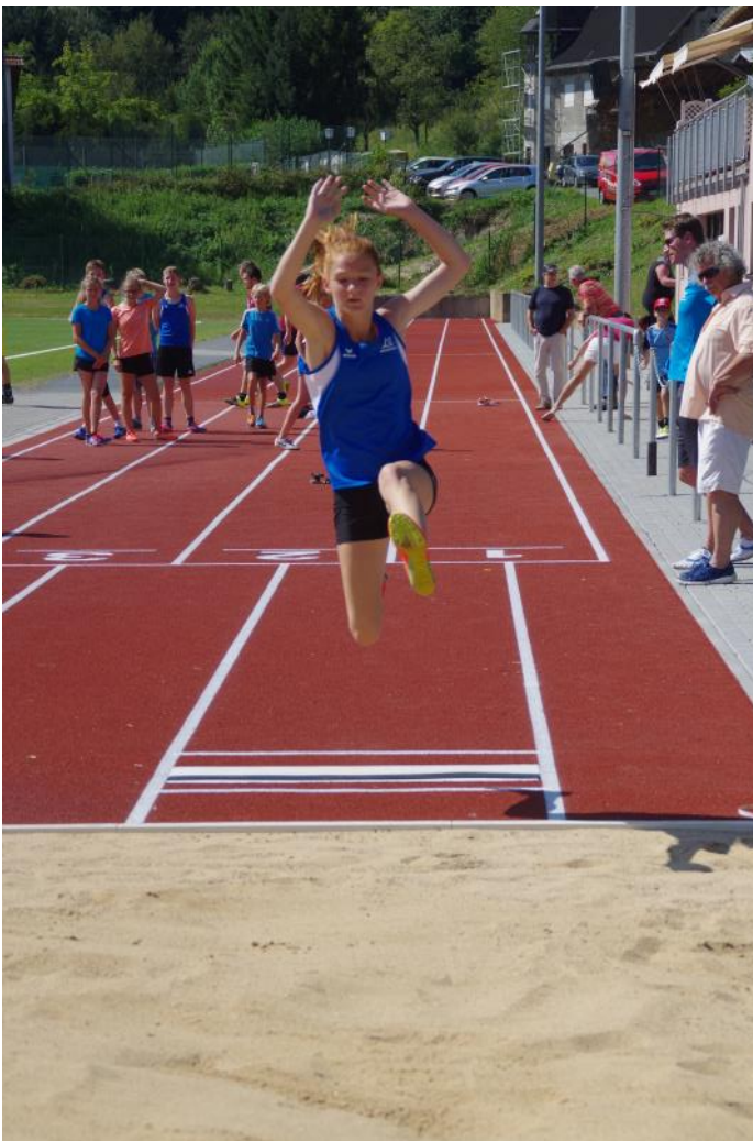
Unsere Leichtathleten zeigten ihr Können auf der neuen Anlage

feld um den Hybridrasenplatz herum zu pflegen und in Ordnung zu halten. Hier können wir nur hoffen das sich für diese sicherlich nicht leichte Aufgabe immer wieder genügend freiwillige Helfer des TuS Rhens dem bereits bestehenden Sportplatz-Team (ähnlich wie das bestehende Teich-Team) zur Verfügung stellen und mit anpacken. Zu ihrer Information: Das Sportplatz-Team trifft sich immer mittwochs von 9.00 bis 12.00 Uhr, freiwillige Helfer sind gerne willkommen. Letztendlich entlasten wir damit unsere Stadtarbeiter und die doch arg gebeutelte Stadtkasse. Liebe Gäste, liebe Mitglieder, wir alle gemeinsam, die Rhenser Bürger, der Stadtrat und der TuS Rhens sind stolz darauf endlich wieder eine moderne, zukunftsgerichtete neue Sportanlage hier im Rhenser Mühlental zu besitzen. Unser und mein persönlicher Dank gilt all denen welche zum Gelingen dieser tollen Anlage ihren Beitrag, egal in