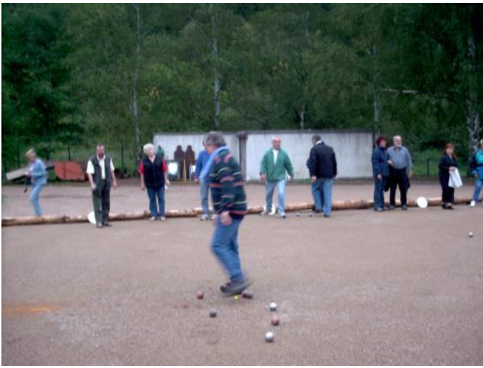
Alter Bouleplatz 2005 - 2015

Nach langer Wartezeit ist es endlich soweit: Seit 29. August 2016 können wir wieder an alter Wirkungsstätte auf dem Sportplatzgelände spielen. Wir teilen jedoch unser Spielfeld mit den Fußballern. Die Nutzung wird in einem Belegungsplan geregelt.