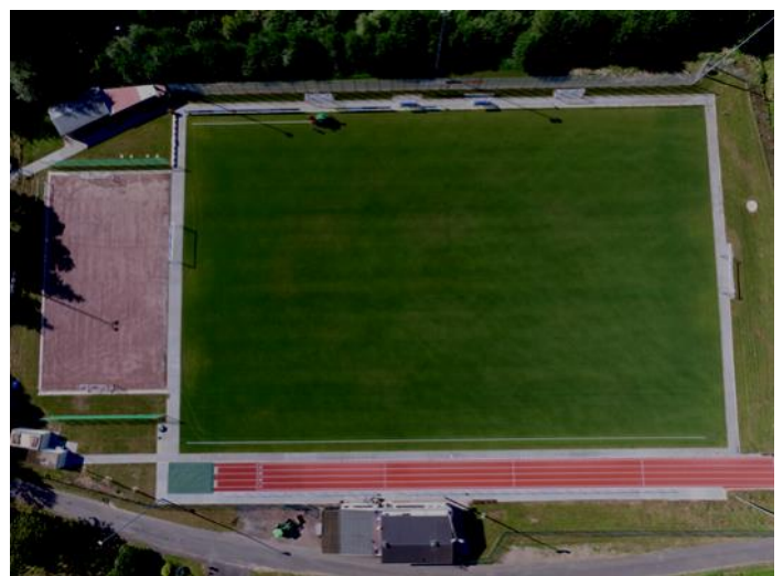
Die neue Sportanlage aus der Vogelperspektive