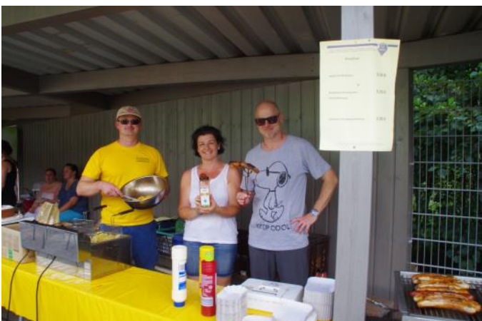
Vielen Dank an die Helfer bei der Einweihungsfeier

Jedoch mit Hilfe der Rhenser Feuerwehr, dem Einsatz unserer Mitglieder und dem Einsatz der Firma