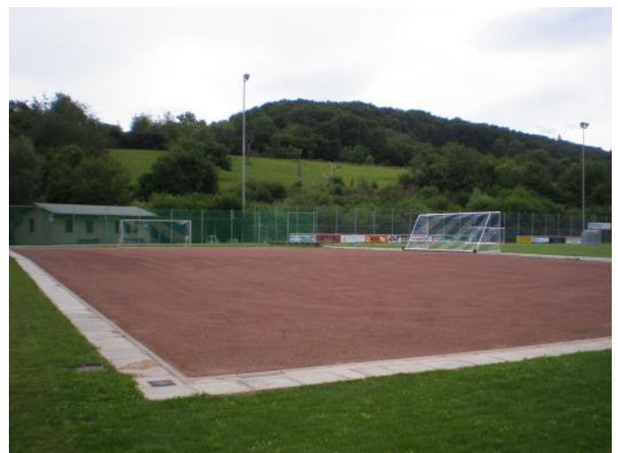
Neuer Bouleplatz seit August 2016

An dieser Stelle möchten wir uns nochmals bei der Stadt Rhens für die Erlaubnis zur Nutzung des Platzes an der Stadtmauer recht herzlich bedanken.