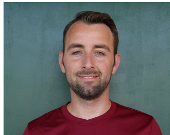
Der neue Kapitän der 2. Mannschaft

Parallel mit der 1. Mannschaft stieg man in die Saisonvorbereitung ein. Trotz hoch intensiver Trainingseinheiten, nahm die Trainingsbeteiligung stetig stark zu und Trainer Toni Link konnte durchschnittlich über 15 Spieler pro Einheit auf dem