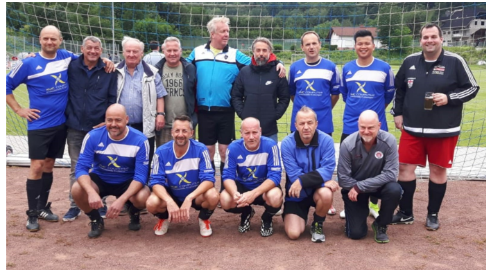
Die Meistermannschaft freut sich über den 4. Platz

Wählen Sie Ihren Lieblingskaffee im Tchibo Frisch-Depot