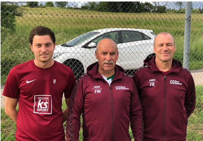
Das neue Trainerteam

Nach einer anderthalbjährigen Hausbau- und Baby-pause ruft das runde Leder wieder.